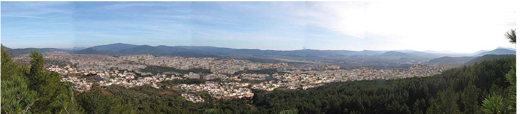
Panorama en 2020